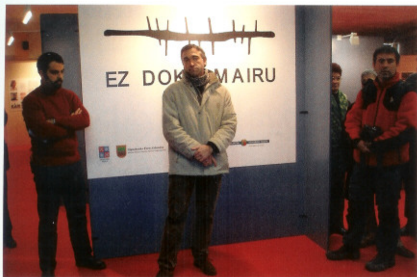
← Jexux Artze Fundazioko arduraduna.